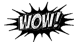
State-wide Average in FY 15